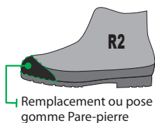
Remplacement ou pose gomme Pare-pierre